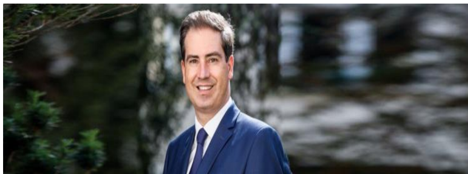
Ministre délégué auprès de la ministre de l'Europe et des Affaires étrangères chargé du Commerce extérieur, de l'Attractivité et des Français de l'étranger

Retrouvez le message d'Olivier Becht et ses priorités